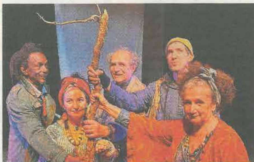
Les interprètes de la pièce "Le syndrome d'Ulysse".

Du 12 au 22 mars au Théâtre du Balcon, Avignon. Prix : de 5 à 23 €. Article intégral à lire sur notre site.